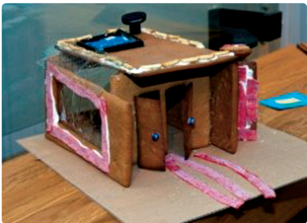
Fig. 52 i

Fra VGs pepperkakehuskonkurranse 2009, VG-nett